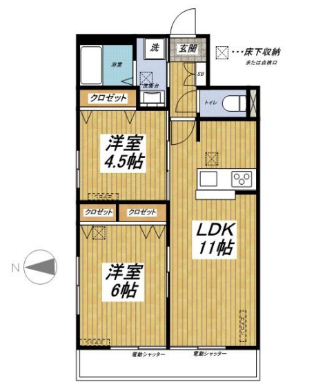
102号室 (49.79m 2 )