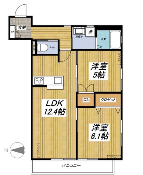
203号室 (57.15m 2 )