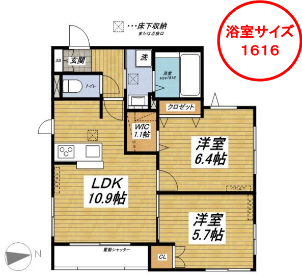
101号室 (55.85m 2 )