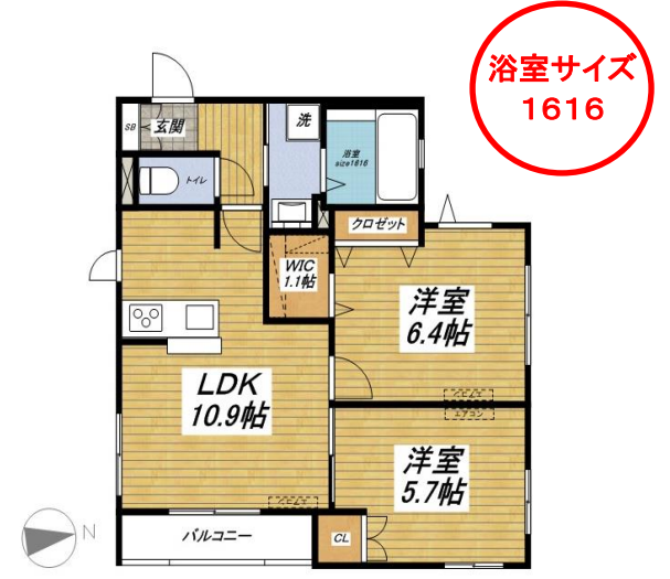
201号室 (55.85m 2 )