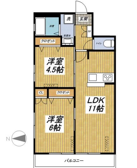
302号室 (49.79m 2 )