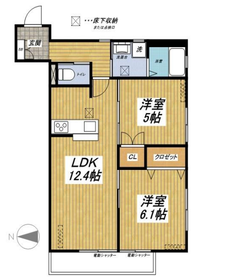
103号室 (57.15m 2 )