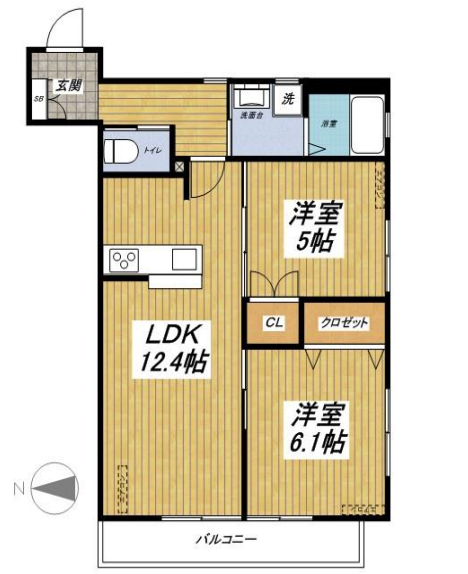
303号室 (57.15m 2 )