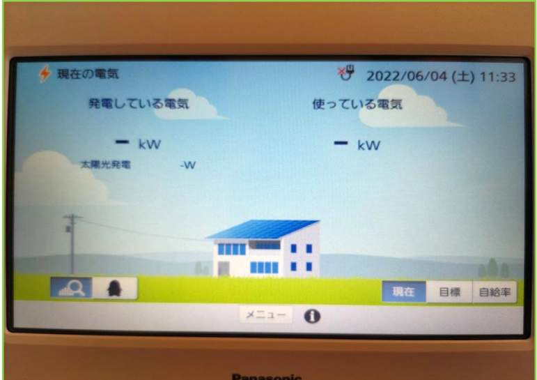
発電状況を確認するモニターのイメージです。

ZEH-Mとは、住まいの断熱性・省エネ性能を上げること、そして太陽光発電などでエネルギーを創ることにより、年間の一時消費エネルギー量(空調・給湯・照明・換気)の収支のプラスマイナス「ゼロ」に近づける住宅です。