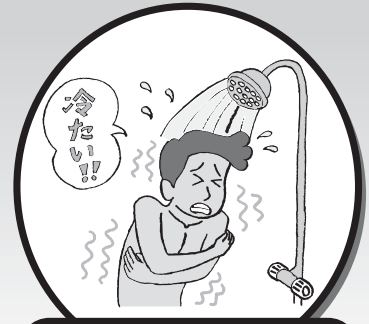
シャワーのお湯が出ない

応急処置 (注) の費用(出張・作業費)は、無料となります。ただし交換部品代および応急処置を超える作業での特殊作業料金は、入居者さまの実費負担となります。